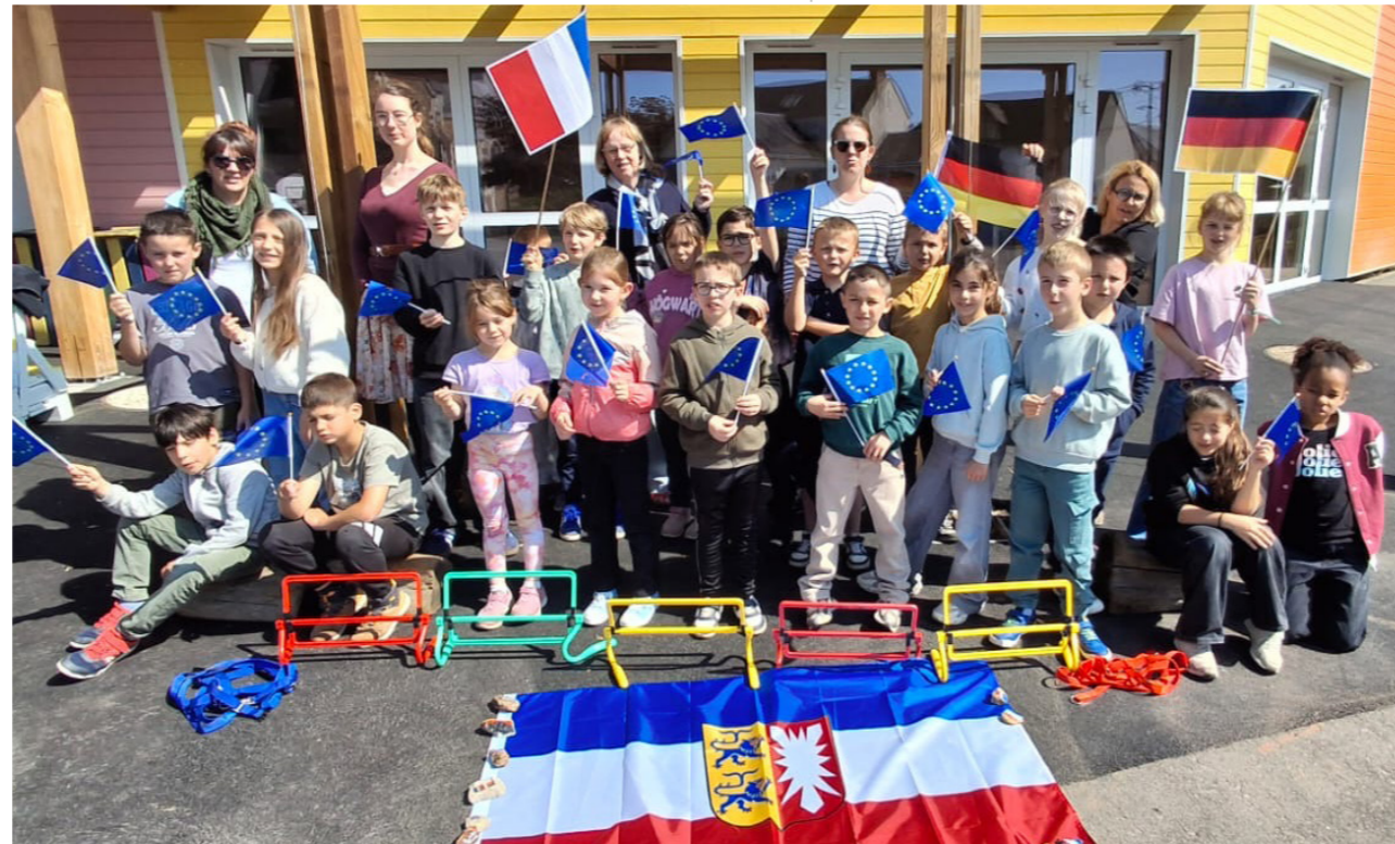
Deutsch-französische Begegnung in Pays de la Loire: Schülerinnen und Schüler aus Schleswig-Holstein erleben Europa im Schulalltag.

Dabei wurde schnell deutlich: Austausch ist weit mehr als ein Besuch im Partnerland. Die Grundschule Wellsee arbeitete mit französischen Partnerinnen und Partnern an kulturellen und musikalischen Projekten. Kinder, die sich vorher nicht kannten, probten zusammen, gestalteten gemeinsam und fanden Wege, sich auch dann zu verständigen, wenn die Worte noch fehlten. Genau darin liegt eine besondere Stärke solcher Begegnungen: Sprache wird nicht nur gelernt, sondern gebraucht – beim Singen, Spielen, Fragen, Zuhören und gemeinsamen Tun.