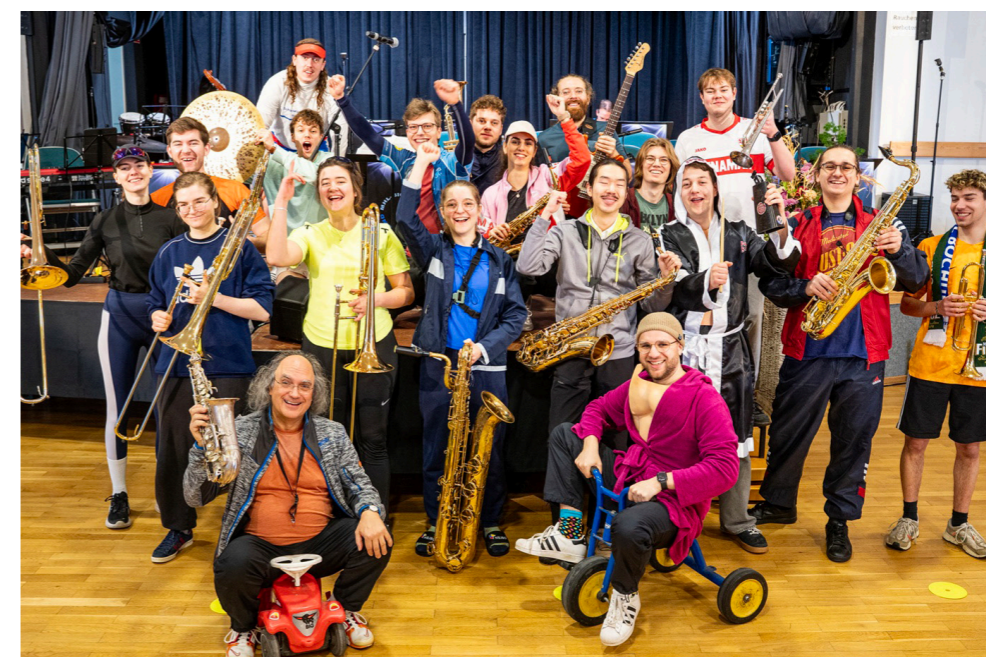
Bunte Truppe: Die Bigband der Musikhochschule Lübeck.

Ein besonderer Höhepunkt ist für den 30. Mai geplant: Dann gestaltet die MHL-Bigband am Bernstorff-Gymnasium in Satrup gemeinsam mit der Schulband ein öffentliches Konzert. So wird aus der Tour nicht nur ein musikalisches, sondern auch ein schulisches Gemeinschaftsprojekt.