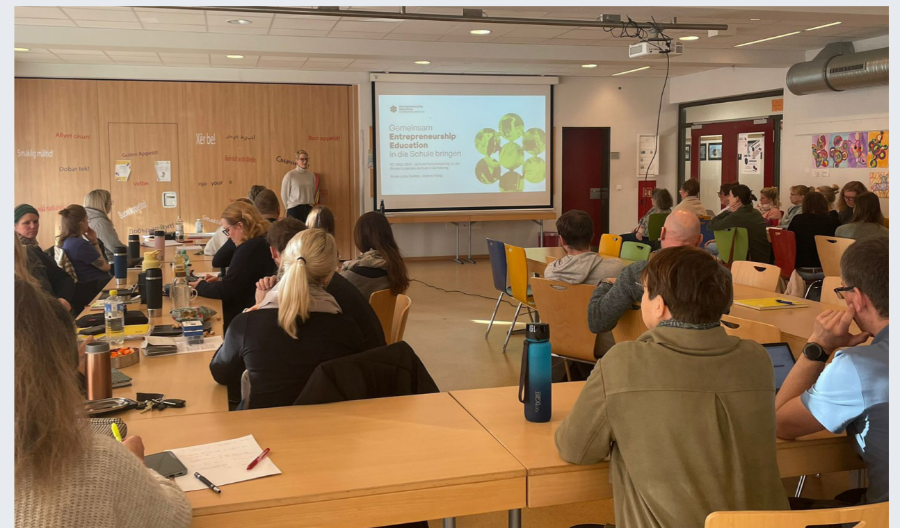
Das Team des EEK kommt auch in die Schulen – wie hier beim Schulentwicklungstag in der Bruno-Lorenzen-Schule in Schleswig.

Zukunft lässt sich gestalten — und Schule ist ein guter Ort, damit anzufangen.