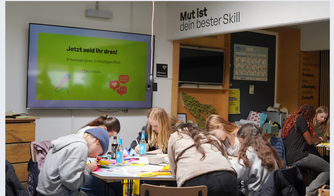
Aus Ideen werden erste Projekte: Schülerinnen und Schüler entwickeln Lösungen, arbeiten im Team und präsentieren ihre Ergebnisse.

Zukunft lässt sich gestalten — und Schule ist ein guter Ort, damit anzufangen.