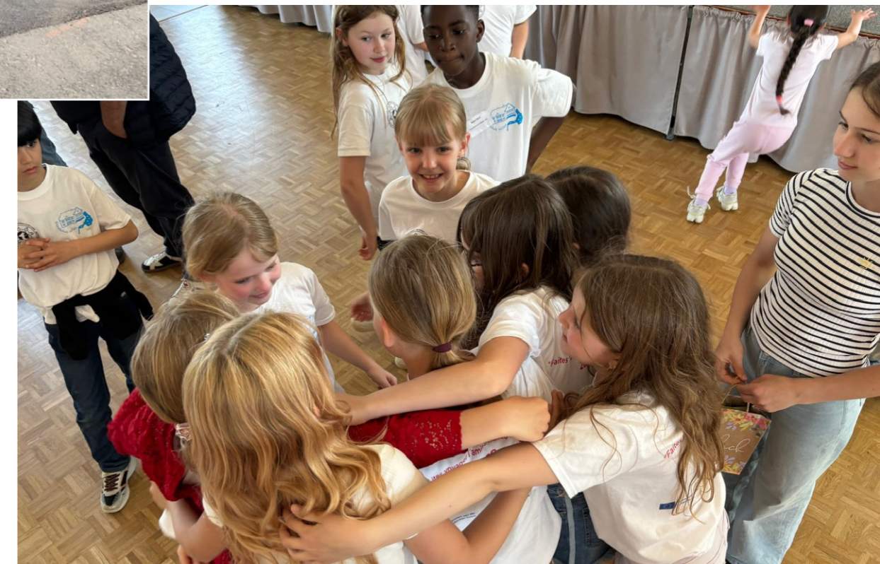
Gemeinsam singen, gestalten, erinnern: Bei der Reise wurde europäische Verständigung ganz unmittelbar erfahrbar.

Für die Schülerinnen und Schüler bleibt vermutlich nicht zuerst die offizielle Unterzeichnung in Erinnerung. Sondern der Moment, in dem aus Schleswig-Holstein mitgebrachte Kieselsteine in Frankreich zu Friedenszeichen wurden. Der Moment, in dem deutsche und französische Kinder gemeinsam sangen. Und die Erfahrung, dass Europa nicht abstrakt ist. Europa kann ein Gesicht haben, eine Stimme – und manchmal auch ein Lied.